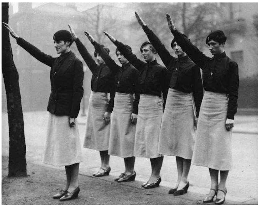
Fig. 1. Divisa da passeggio disegnata dalle sorelle Botti, immagine tratta da «Patria indipendente», periodico dell'Associazione Nazionale Partigiani Italiani, https://www.patriaindipendente.it/servizi/sexo-e-fascismo-regole-doppiezza-morale-e-politica-demografica-nellera-mussolini/