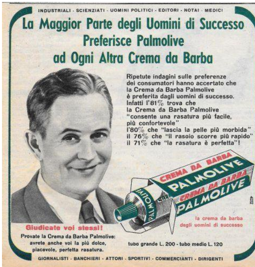
Fig. 2., Pubblicità: Crema da barba (Palmolive), in «Tempo», 1956.