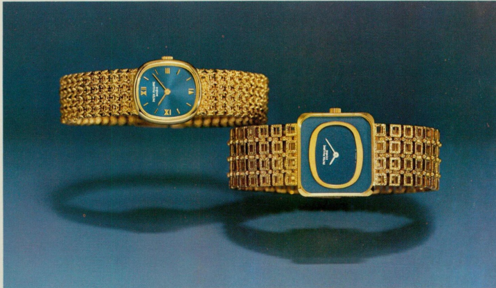
Modello 4201/1, oro giallo 18 carati Modello 4183/1, oro giallo 18 carati

Chi sceglie un Patek Philippe lo sceglie come un gioiello prezioso: per il piacere profondo che dà un oggetto raro, squisito, creato dall'abilità magistrale di un artigiano. Un gioiello firmato Patek Philippe si trasmette di padre in figlio, di generazione in generazione. È uno splendido orologio, certo. Ma chi desidera solo saper l'ora sceglie semplicemente un orologio, non un Patek Philippe.