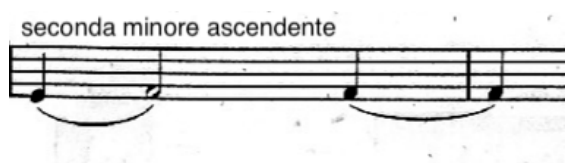
Es. 19, bat. 60