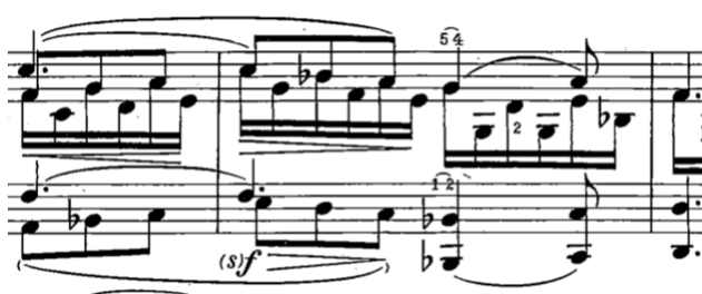
Es. 5, batt. 59-61, codetta, pianoforte