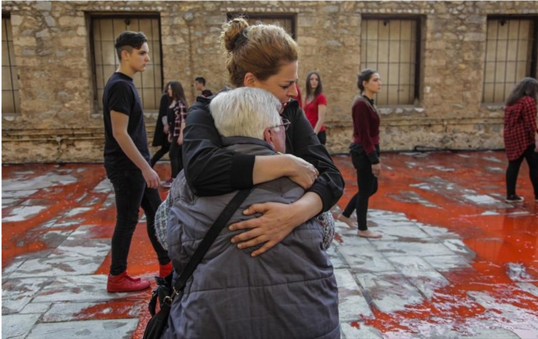
Mary Zygouri, The Encirclement: Redness 1979 – Redness 2017 M.Z./M.K. , Block Kokkinia, ph kelly_kiki_