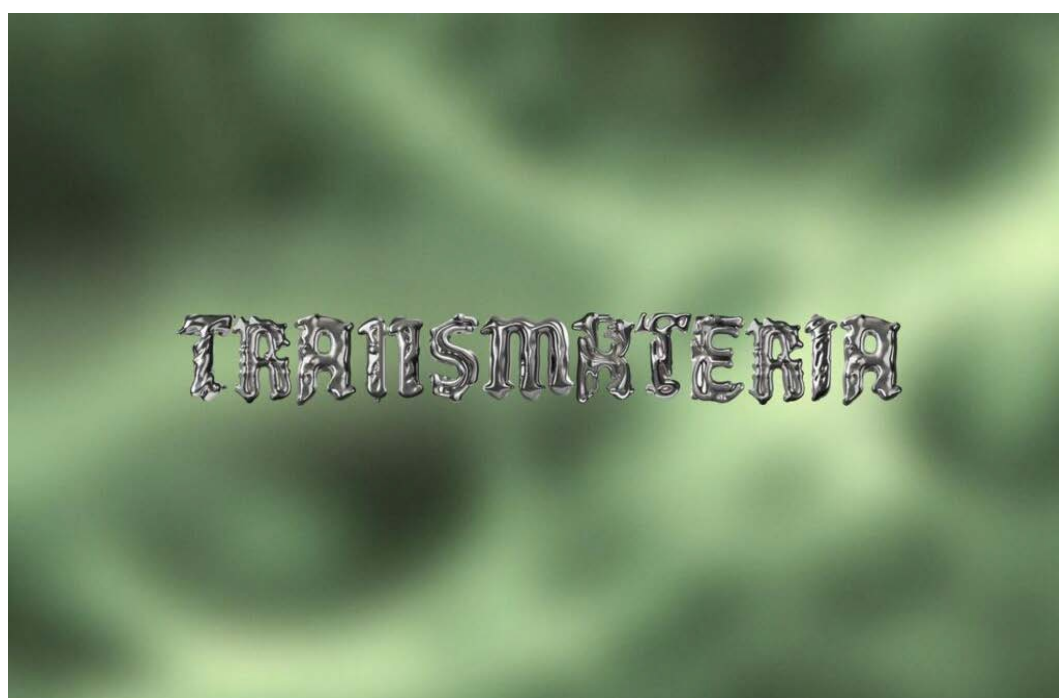
Dogyorke, Transmateria , settembre 2024