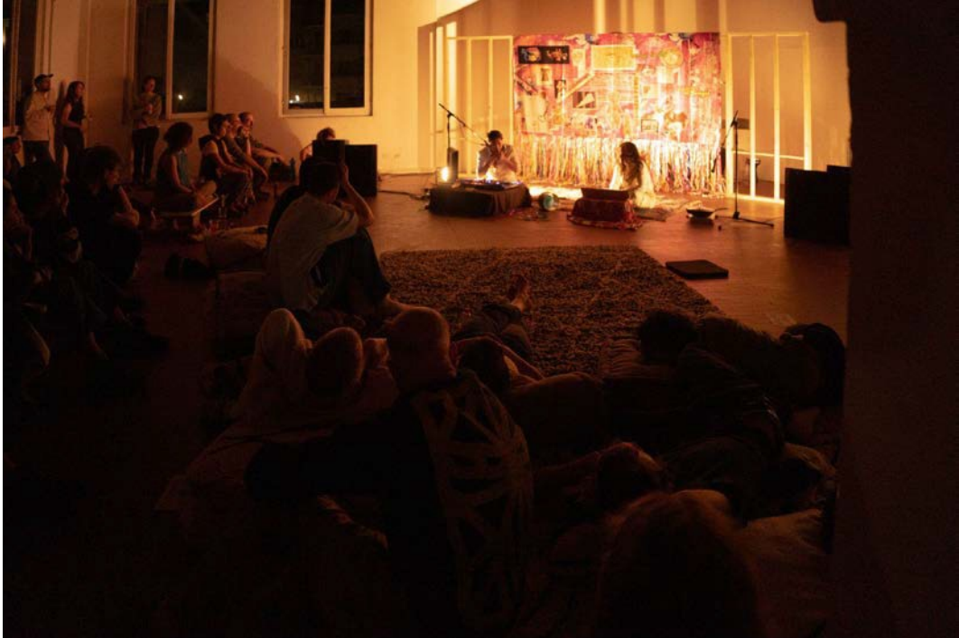
Suoni e Accensioni dalla Palestina e dal Mondo, Le Alleanze 2024, L'orda magica sopra MIJWIZ SIKU-SIKU MIJWIZ , Noura Tafeche e Ismael Condoii sotto KARAKOZ live set , MAI MAI MAI