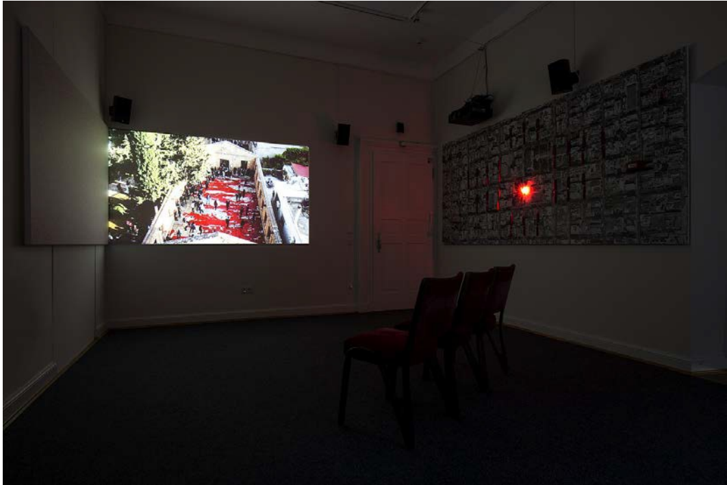
Mary Zygouri, The Round-up Project: Kokkinia 1979-Kokkinia 2017 \ M.Z. \ M.K , 2017, installation view, Palais Bellevue, Kassel, documenta 14