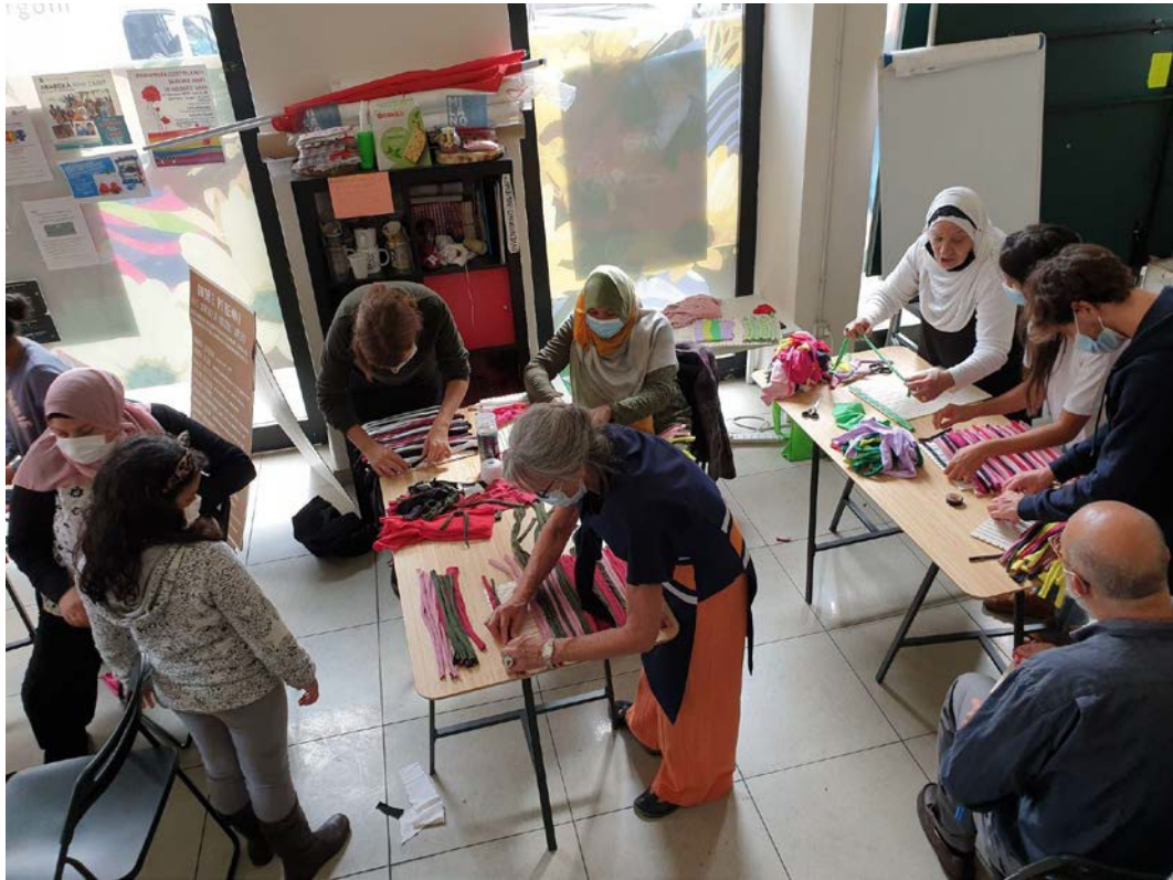
Elisabetta Consonni, Fatima Ferro, Special Handling , 2021 Via Padova, Milano ph. Elisabetta Consonni.