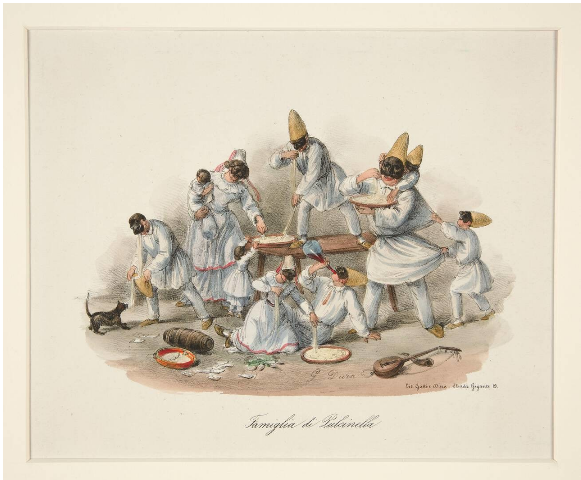
Figura 3.4, Gaetano Dura, Famiglia di Pulcinella , 1851 ca., Yale University Art Gallery, Yale, https://artgallery.yale.edu/collections/objects/104544 , consultato il 31 marzo 2026.

caratterizzati dalla tipica maschera nera e dall'abito bianco della tradizione, sono intenti a mangiare o a contendersi il cibo, dando vita a una situazione di vivace disordine. I figli appaiono come vere e proprie repliche del padre, di cui hanno già ereditato non solo il vestiario, ma anche la gestualità e l'insaziabile voracità. Questa moltiplicazione della stessa figura all'interno del nucleo familiare produce un effetto grottesco e parodico, trasformando Pulcinella da individuo singolo in un tipo collettivo.