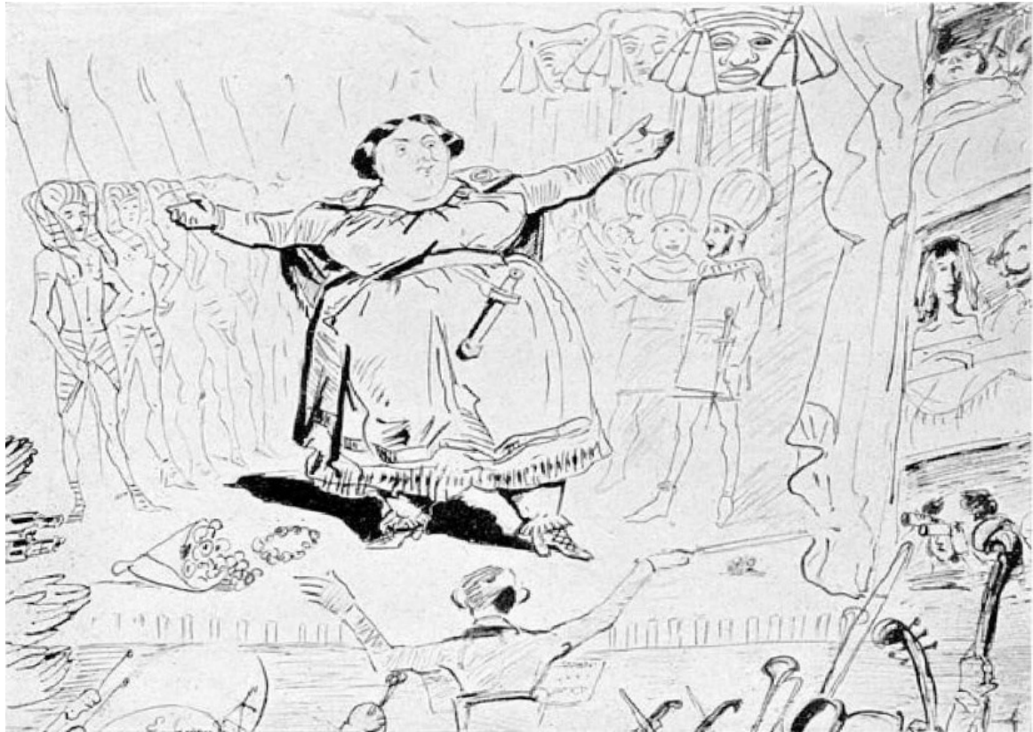
Figura 2.6, Eugène Giraud, Marietta Alboni nel ruolo di Arsace nella Semiramide di Rossini, riprodotta in LIONEL DAURIAC, Rossini. Biographie critique, Parigi, Laurens, 1902, https://w.wiki/KcrM , consultato il 31 marzo 2026.