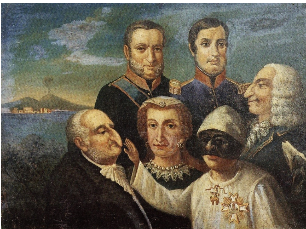
Figura 3.6, Anonimo, Pulcinella e i Borbone di Napoli, prima metà del XIX secolo, collezione Giuliana Gargiulo, Napoli.

inequivocabile dell'identità napoletana. Il dipinto allude alla connessione tra i Borbone e il popolo; tuttavia, la composizione non è priva di una sottile ironia: la presenza di Pulcinella tra i membri del Toson d'Oro costituisce infatti un commento implicitamente parodico su un titolo che, per tradizione, dovrebbe essere associato a valori di serietà e prestigio. In questa prospettiva, la figura del buffo – sia nella pratica performativa sia nella rappresentazione figurativa – appare come un punto di intersezione privilegiato tra potere, popolo e immaginario, rendendo visibile la natura profondamente costruita e politica della cultura borbonica.