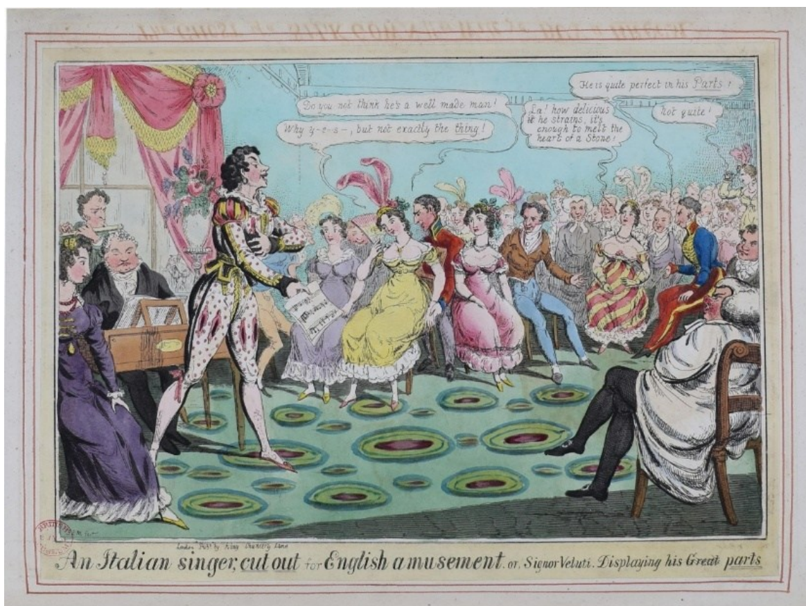
Figura 1.1, John Lewis Marks J. L., An Italian singer, cut out for English amusement. Or, Signor Veluti [sic]. Displaying his Great parts , 1825, British Museum, Londra, https://www.britishmuseum.org/collection/object/P_1935-0522-6-170 , consultato il 31 marzo 2026.

In tale contesto, la presenza di Velluti si configura come un problema di forte carica simbolica, all'interno del quale vengono condensate tensioni e conflitti di natura sociale e politica. La sua esposizione nello spazio pubblico, veicolata e amplificata dai media contemporanei, in particolare attraverso il ricorso a caricature e forme di rappresentazione satirica, trasforma il corpo del cantante in un luogo prediletto per la lotta politica. La caricatura di John Lewis Marks, pubblicata nel 1825 dall'editore King, risulta particolarmente significativa in questo contesto (fig. 1.1).