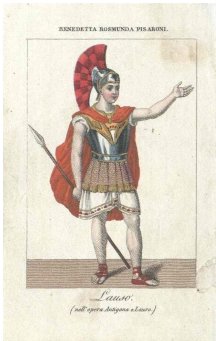
Figura 2.2, Anonimo, Rosmunda Pisaroni nel ruolo di Lauso, XIX secolo, Österreichische Nationalbibliothek, Vienna, https://data.onb.ac.at/rep/BAG_9268436 , consultato il 31 marzo 2026.

producendo un effetto che può essere percepito come comico e perturbante. I registri sono volutamente contrapposti: eroico e caricaturale, maschile e femminile, nobile e irregolare. L'approccio satirico è particolarmente evidente confrontando l'acquerello di Chalon con una stampa che ritrae Pisaroni nei panni di Lauso nell'opera Antigona e Lauso (1822) di Stefano Pavesi, andata in scena il 26 gennaio 1822 al Teatro alla Scala (fig. 2.2).