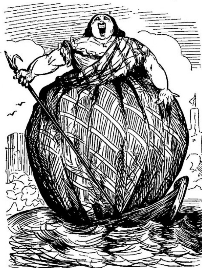
Alboni dans la dona del Lago .

ma incessantemente riportata alla sua corporeità, che diventa oggetto di osservazione, amplificazione e controllo simbolico.