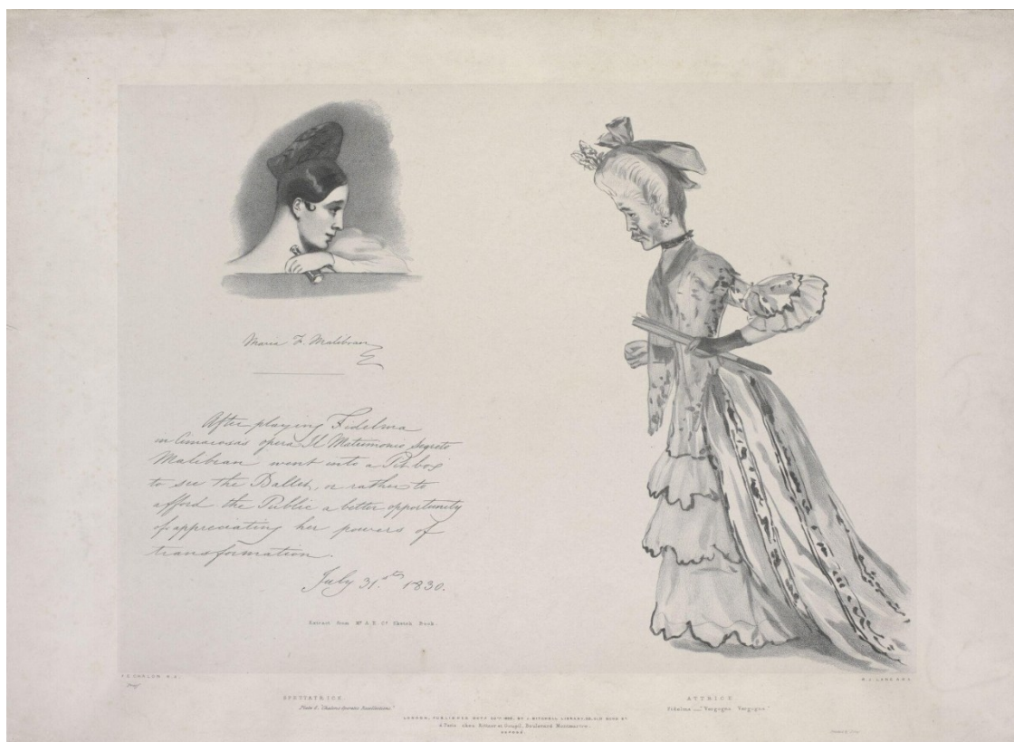
Figura 2.3, Alfred Edward Chalon, Richard James Lane (litografia), Spettatrice and Attrice , 1836, Victoria and Albert Museum, Londra, https://collections.vam.ac.uk/item/O181481 , consultato il 31 marzo 2026.